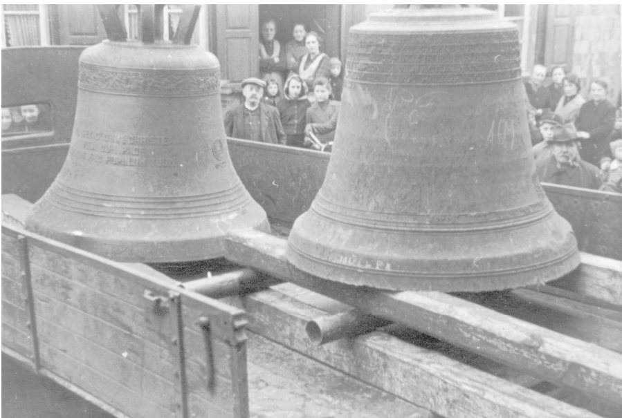
Abb.: 76 Die beiden größten Glocken von St. Peter bei der Ablieferung 1942: links die Christkönigglocke von 1937, rechts die Petrusglocke von 1765

1940 begann die neuerliche kriegsbedingte Erfassung der Kirchenglocken. 1942 mußten die neue Christkönig- und die zweitgrößte Petrusglocke an die Reichsstelle für Metalle abgeliefert werden. 17 Die Christkönig-Glocke wurde vermutlich direkt eingeschmolzen. Einzig die Marienglocke verblieb als Läuteglocke in Ehrang, wurde jedoch schließlich bei einem Bombenangriff 1945 zerstört. Im Herbst 1945 überließ Luxemburger Bahnpersonal der Kirche eine kleine, etwa 50 kg schwere Glocke, die laut Inschrift 1842 von Johannes und Wilhelm Mabilon in Saarbarg gegossen wurde. 18 1948 kam die alte Petrusglocke beschädigt nach Ehrang zurück.