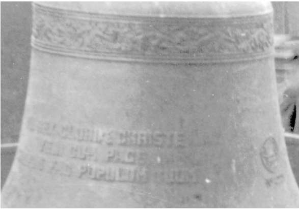
Abb.: 77 Christkönig- glocke von 1937, Schul- terzierer und Inschrift der Flanke