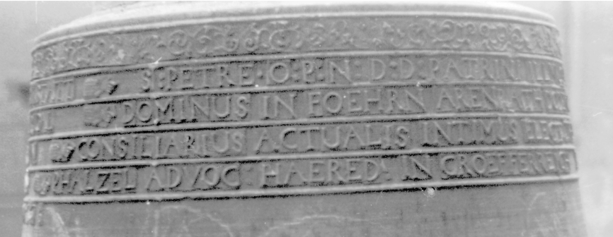
Abb.: 75 Petrusglocke von 1675 (Fotografie von 1942), Detail der Schulter mit der Inschrift