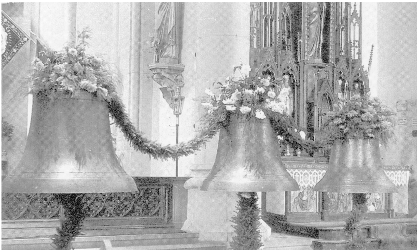
Abb.: 78 Die neuen Glocken bei ihrer Weihe 1949. (Schuhn gibt irrtümlich die Glockenweihe im Jahre 1937 an.)

Bereits 1946 begannen die Planungen zum Guß eines neuen Geläutes, das schließlich 1949 von der Gießerei Albert Junker in Brilon aus sog. „Briloner Sonderbronze“, einer Kupfer-Silizium-Legierung (s.u.) gegossen und am 2. Oktober 1949 durch Pfarrer und Dechant Schieben geweiht wurde. Die beiden alten Glocken wurden der Gießerei in Zahlung gegeben. 19 Der Guß der geplanten größten Glocke mit dem Schlagton cis' unterblieb bis heute. 20