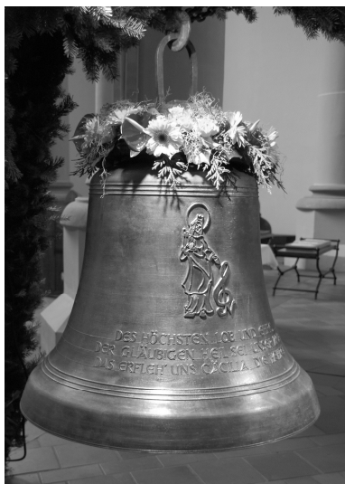
Abb. 123: Glocke IV (Cäcilia) am Tag ihrer Weihe.