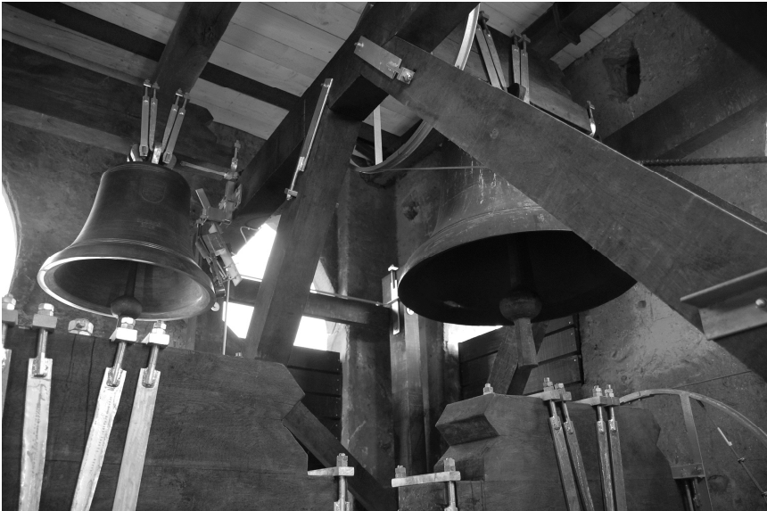
Abb. 129: Blick in die Glockenstube mit dem neuen Glockenstuhl. Unten sind die Holzjoche der beiden großen Glocken zu erkennen, links oben die kleinste Glocke V (Mutter Rosa), rechts oben die mittlere Glocke.