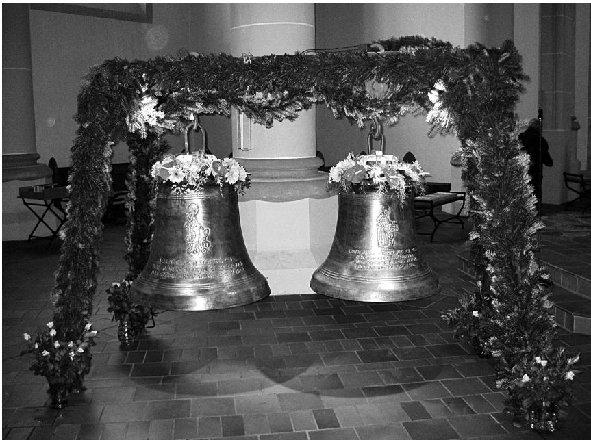
Abb. 121: Die beiden neuen Glocken „Hl. Cäcilia“ und „Mutter Rosa“

Die Weihe von neuen Glocken für ihren Dienst ist ein besonderes und zukünftig sicher immer seltener werdendes Ereignis: In einem feierlichen Gottesdienst in der Pfarrkirche St. Peter am 29. November, dem 1. Advent 2009,