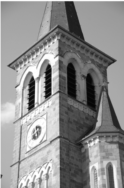
Abb. 131: Die Glockenstube nach der Umgestaltung. Die Jalousien liegen nun deutlich näher beieinander und sind zusätzlich von hinten geschlossen, so daß die Glockenstube zum idealen Resonanzraum wird.