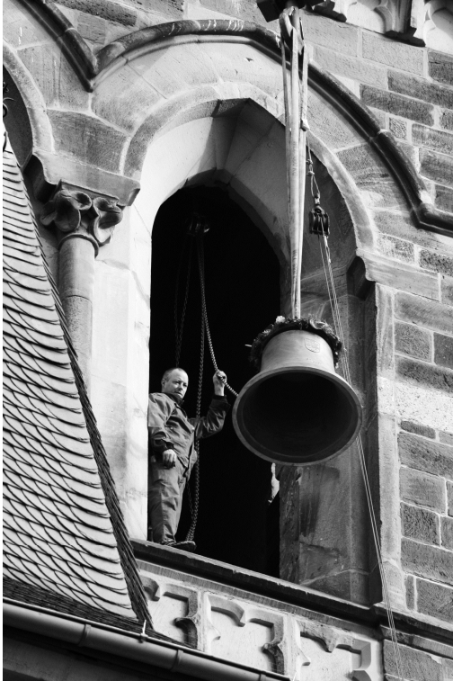
Abb. 122: Einbringen der neuen Glocken in in den sanierten Glockenstuhl am 7. Dezember 2009