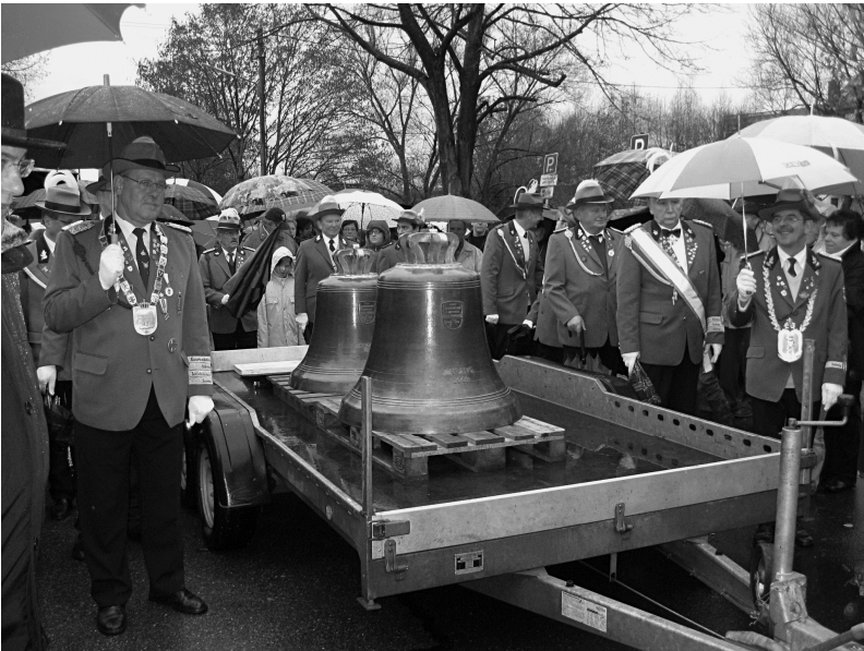
Abb. 120: Empfang der beiden neuen Glocken durch die Bevölkerung und Prozession zur Pfarrkirche St. Peter, begleitet von der Ehranger Schützenbruderschaft