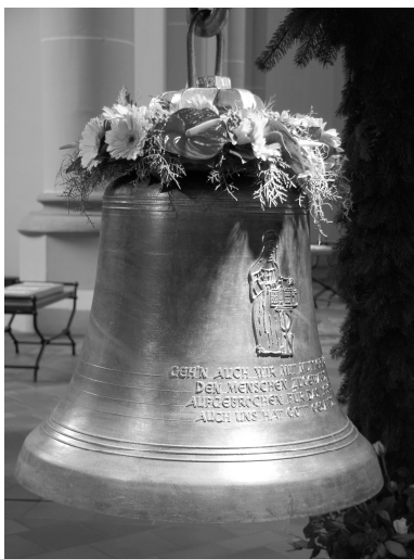
Abb. 125: Glocke V (Mutter Rosa) am Tag ihrer Weihe.