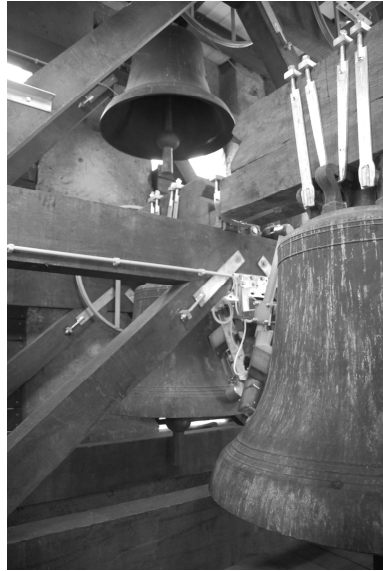
Abb. 128: Die drei alten Glocken im neuen Holzstuhl.