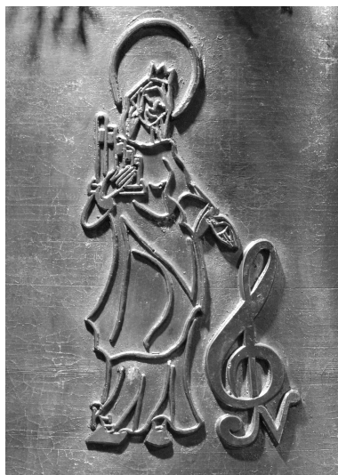
Abb. 124: Glockenzier auf Glocke IV: Die hl. Cäcilia mit kleinem Portativ und Notenschlüssel.